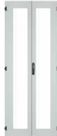
Sichttür, zweiteilig, mit 3 mm ESG