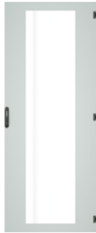
Sichttür, einteilig, mit 3 mm ESG