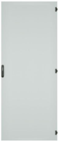
Stahlblechtür, einteilig, geschlossen