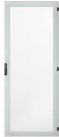
Stahlblechtür, einteilig, passiv belüftet (Wabenloch, 81 % offene Fläche)