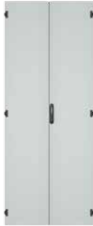
Stahlblechtür, zweiteilig, geschlossen