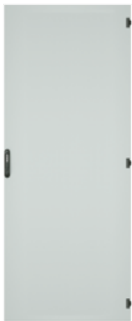
Stahlblechtür, einteilig, geschlossen