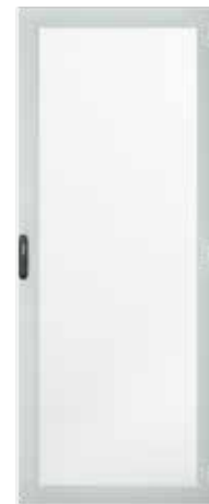
Stahlblechtür, einteilig, passiv belüftet (Wabenlochung, 81 % offene Fläche)